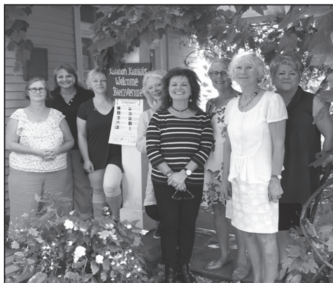
Some Members of the StoryFest Team Quelques Membres de l'Équipe StoryFest