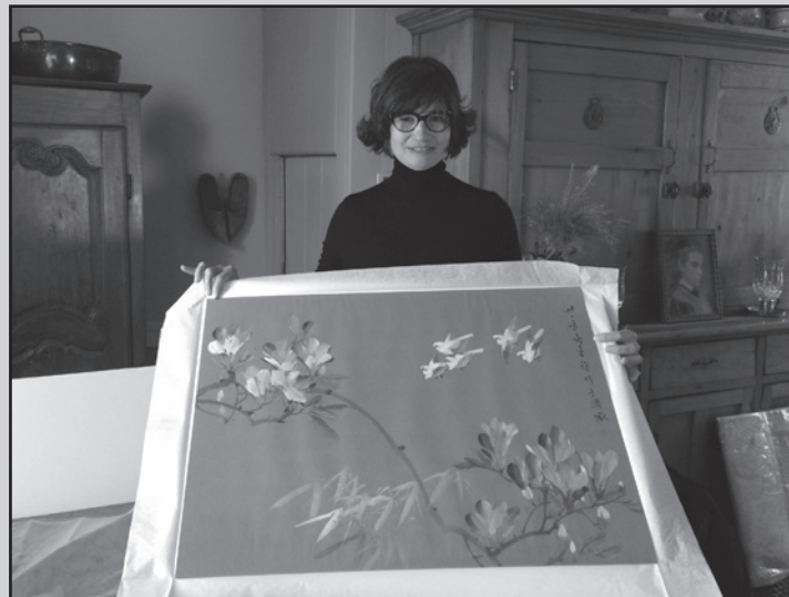
right- Asian watercolour entitled Flowers and Birds. Conservation done by Severine Chevalier, Conservator of Works on Paper